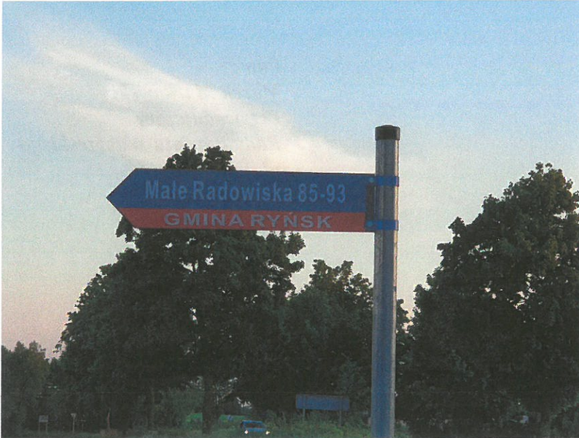
Zdjęcie nr 1: Wyjazd z drogi gminnej.