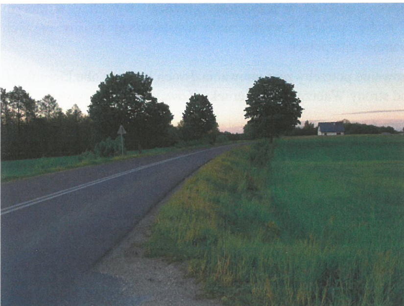
Zdjęcie nr 4: Wyjazd od strony Wąbrzeźna w kierunku Kowalewa-Pomorskiego.