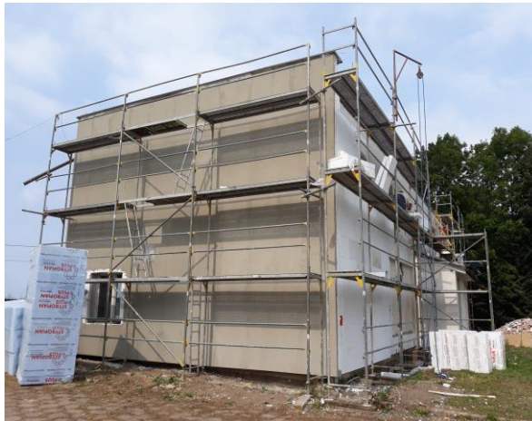
Remont placówki – sierpień 2018 r.