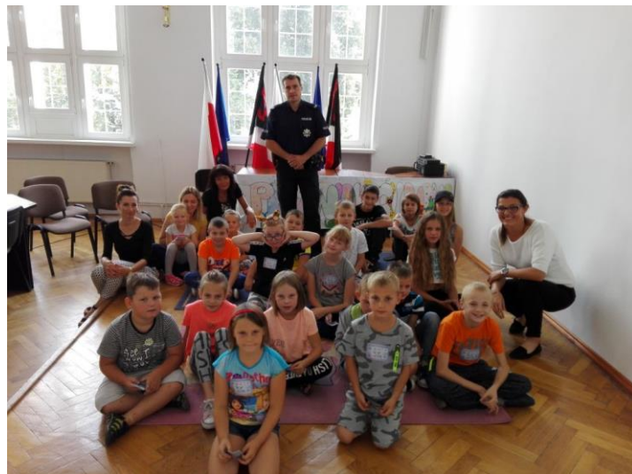
Wakacje z PCPR