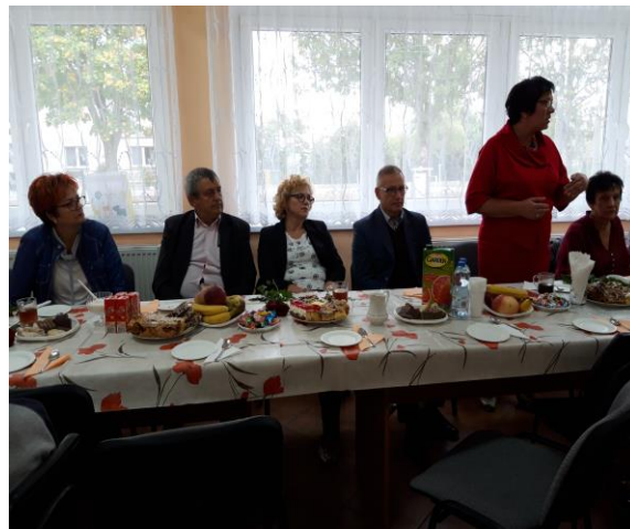
VII Integracyjny Piknik Rodzinny