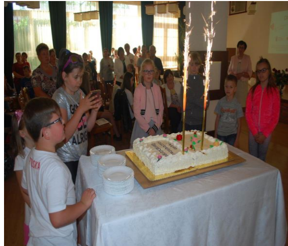
Święto Rodzicielstwa Zastępczego