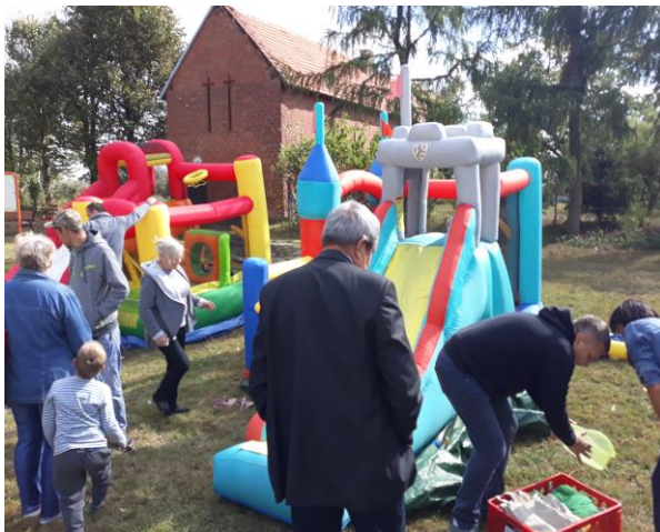
VII Integracyjny Piknik Rodzinny