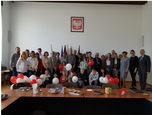
Zakopywanie kapsuły czasu