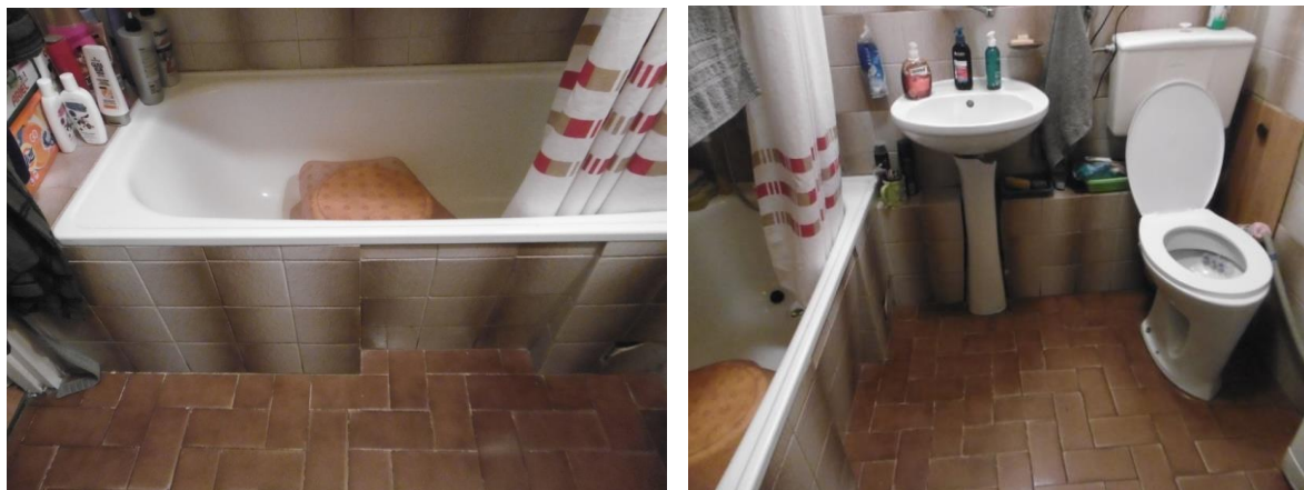
Pomieszczenie przed likwidacją barier architektonicznych

W ramach likwidacji barier architektonicznych dokonano przystosowania pomieszczeń higieniczno-sanitarnych do potrzeb osób niepełnosprawnych.