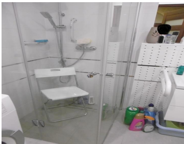
Pomieszczenie po likwidacji barier architektonicznych