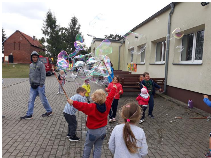
VII Integracyjny Piknik Rodzinny

Pracownicy zorganizowali także takie imprezy jak : bal karnawałowy oraz mikołajki dla dzieci z rodzin zastępczych.