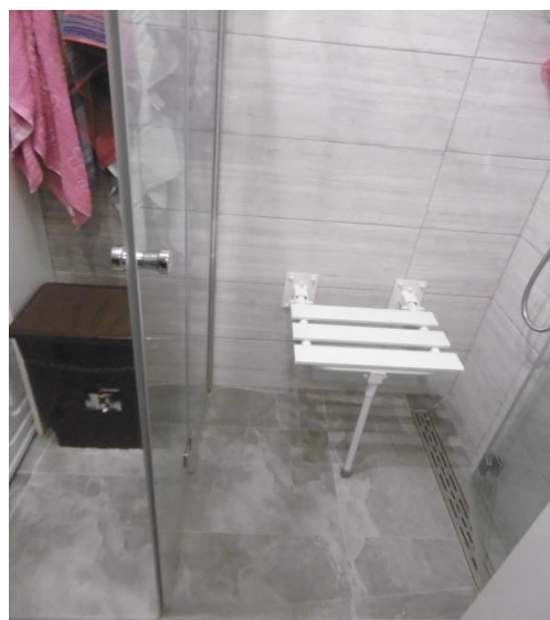
Pomieszczenie po likwidacji barier architektonicznych

Na dofinansowanie likwidacji barier w komunikowaniu się wpłynęły 22 wnioski, w tym 16 wniosków osób dorosłych i 6 wniosków o dofinansowanie dla dzieci. Dofinansowanie otrzymało 1 dziecko na zakup komunikatora.