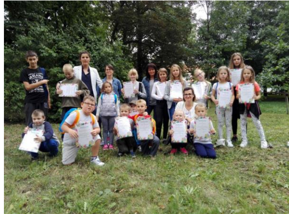
Wakacje z PCPR