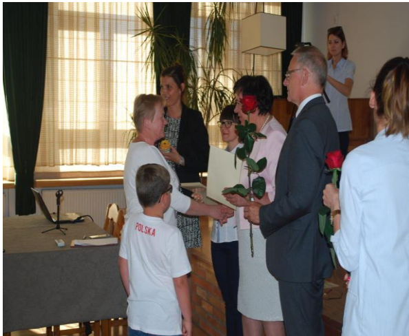
Święto Rodzicielstwa Zastępczego