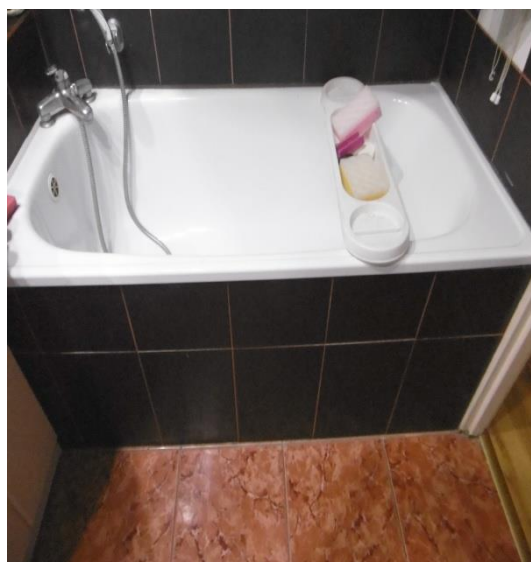
Pomieszczenie przed likwidacją barier architektonicznych